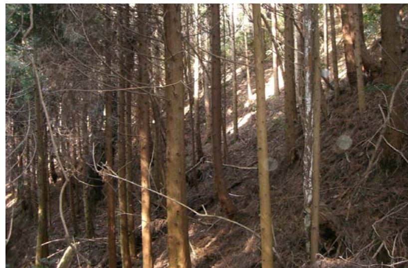
植栽されたまま放置された森林

人工林の多くは戦後に植栽がされ木材価格の低迷と共に手入れがされなくなってきました。また、森林施業が実施されない事で所有界、施業履歴等も不明確になりつつあります。材価の低迷から所有者の手入れの意欲が減り放置森林が増えてきています。人の手によって植栽したものは、人の手によって管理(手入れ)をしないと材価の低下や森林災害(雪害・風害・地すべり等)の原因になります。